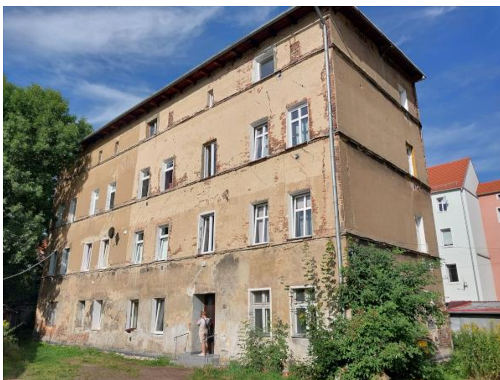
Fot. 1 Widok na inwentaryzowany budynek – front budynku.