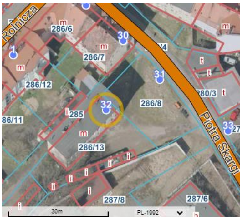
Rys. 1. Mapa przedstawiająca lokalizację budynku.